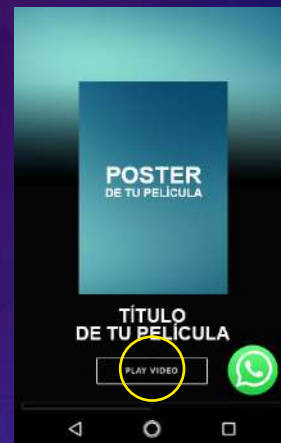
Vista desde mobile/smartphone